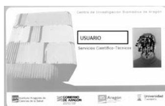
Imagen tarjeta Usuario

Para solicitar la entrada en el Animalario se deberá rellenar una ficha de solicitud de acceso (y la documentación asociada que solicita) que se facilitará en el momento que la persona interesada se ponga en contacto con el Responsable Técnico de Animalario. Una vez recibida la ficha completa y verificados los documentos adjuntos necesarios dependiendo del perfil de acceso, el Responsable Técnico del Animalario procederá a su autorización de acceso. Desde RRHH del CIBA se les suministrará una tarjeta de usuario para que puedan acceder con ella al interior de la instalación.